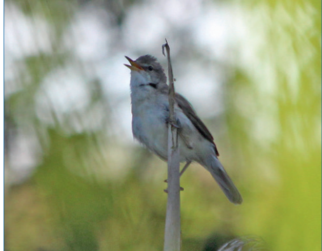
Singendes Männchen des Buschrohrsängers bei Aulosen/SDL am 07.06.2014.