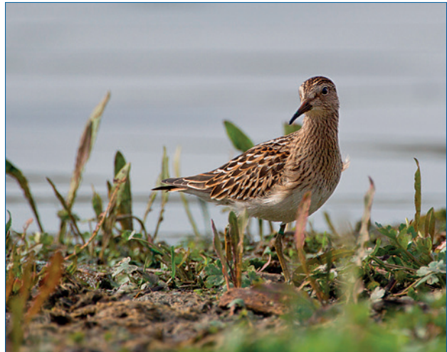
Diesjähriger Graubrust-Strandläufer in der Grube Amsdorf/MSH, 21.09.2012.

Phänologie des Auftretens des Graubrust-Strandläufers in Sachsen-Anhalt (n = 21 Ind.). Bei Vögeln mit längerem Aufenthalt wurde das Datum der Erstbeobachtung gewertet.