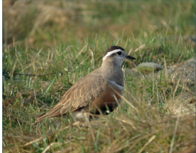
Adultes Weibchen des Mornellregenpfeifers am 23.04.2014 auf dem Brocken/HZ.