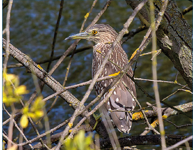
Nachtreiher im 1. Kalenderjahr am 13.08.2014 in der Kiesgrube Meitzendorf/BK.

Ansonsten tritt die Art als Ausnahmeerscheinung mit zunehmender Tendenz auf. Von 1800 bis 1925 sind mindestens 30 Ind. (2,4 Ind./10 Jahre) erlegt bzw. nachgewiesen worden (BORCHERT 1927, HILDEBRANDT 1927, JUST 1832). Für den Zeitraum 1926 bis 2014 wurden in regionalen Avifaunen und den Berichten der Seltenheitenkommissionen von Bund und Land etwa 80 Nachweise (8,8 Ind./10 Jahre) dokumentiert. Beobachtungen sind in allen Monaten des Jahres möglich. Von 88 Feststellungen erfolgten 18 im Mai, 28 im Juni/Juli, 18 im August, 9 im September und 15 von Oktober bis April (vgl. KOLBE & NEUMANN 1988). Bei insgesamt 114 registrierten Individuen sind vorwiegend Einzelvögel nachgewiesen worden (82 %), selten 2 (8 %), und im Juli 1961 ausnahmsweise 4 Ind. als Gruppe neben 3 BP sowie 4 Ind.