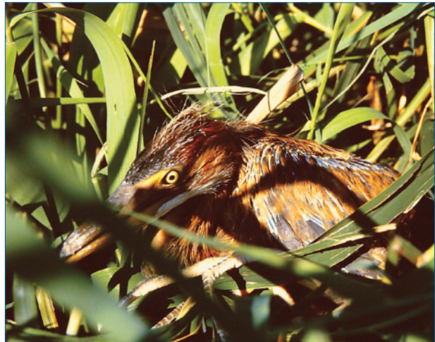
Fast flügger Jungvogel aus der bislang einzigen Purpurreiherbrut in Sachsen-Anhalt im Trebbichau-Elsnigker Teichgebiet/ABI im Juli 1995.