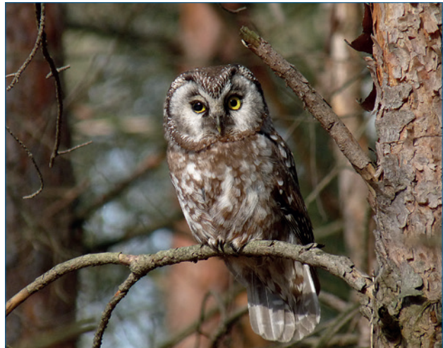
Weibchen des Raufußkauzes am 17.04.2013 bei Golmenglín/ABI.