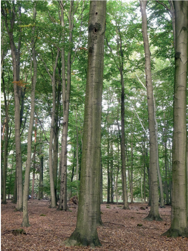
Brutplatz des Raufußkauzes in Buchen-Altholzinsel im Fläming bei Goltmenglín/ABI. 24.09.2010.

Einbringung eines Unterbaus führen durch die aufwachsenden Jungbäume als Strauchschicht und den geringeren Deckungsgrad in den oberen Stammbereichen großflächig zu einem pessimalen Bruthabitat.