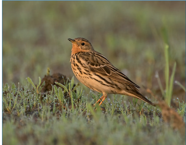
Rotkehlpieper am 03.05.2009 am Salzigem See/MSH.