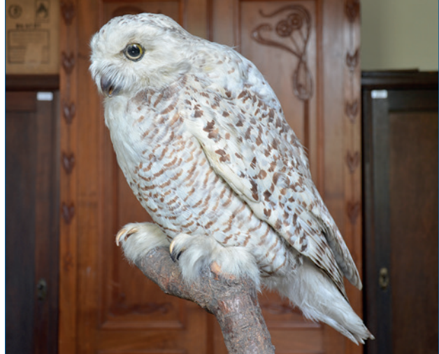
Standpräparat der Schneeeule in der Sammlung des Naturkundemuseums Magdeburg (Inventar-Nr. Z 535), das nach dem Datenbankeintrag aus Mennewitz bei Aken/ABI stammt und sich höchstwahrscheinlich auf den Vogel bezieht, der im Winter 1888/89 dort geschossen worden ist.

Auftreten der Schneeeule in Sachsen-Anhalt im Zeitraum seit 1800 (n = 23 Ind.; soweit sich Beobachtungen nur einem bestimmten Winter zuordnen lassen, sind sie je betroffenem Kalenderjahr mit 0,5 zugeordnet worden).