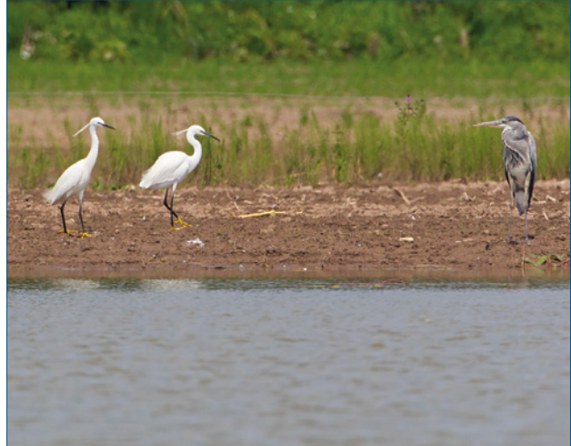
Zwei adulte Seidenreiher mit Graureiher am 09.07.2013 bei Hohenweiden/SK.