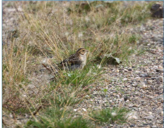
Spornammer auf Schotterweg im Feuchtgebiet Frose/SLK, 27.10.2012.