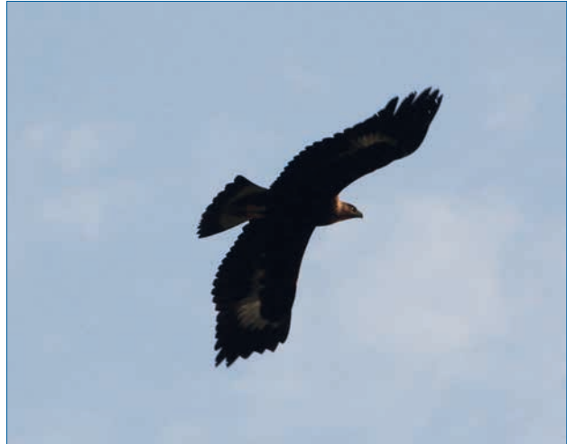
Steinadler im 1. Kalenderjahr am 25.11.2011 in der Elbeaue bei Fischbeck/SDL.